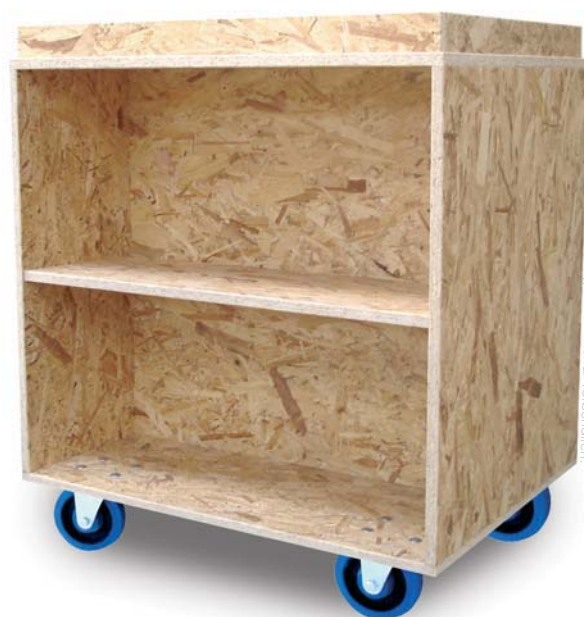
Änderungen in der Ausführung und Material vorbehalten.

Zur Absicherung aufliegender Standard-Umzugskartons