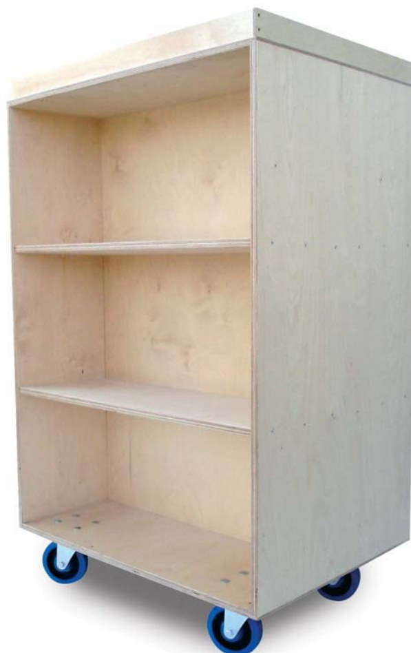
Änderungen in der Ausführung und Material vorbehalten.

Zur Absicherung aufliegender Standard-Umzugskartons