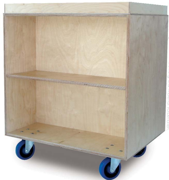
Änderungen in der Ausführung und Material vorbehalten

Zur Absicherung aufliegender Standard-Umzugskartons