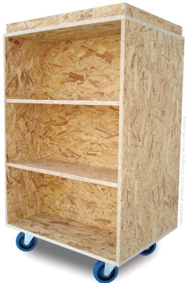
Änderungen in der Ausführung und Material vorbehalten.

Zur Absicherung aufliegender Standard-Umzugskartons